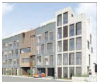
Die Vorderansicht der neuen Stadthäuser. Visualisierung: Planpartner Architekten

denwünsche natürlich ein.“ Der Preis der exklusiven Stadthäuser liegt bei etwa 650.000 Euro. Die Häuser haben eine Wohnfläche von 240 bis 300 Quadratmeter, werden mit Aufzug ausgestattet und sollen in 14 Metern Höhe eine gute Aussicht auf die Innenstadt erhalten. Das Quartier rund um den Schützenplatz werde damit weiter zum exklusiven Wohnstandort im Stadtzentrum entwickelt. Unter anderem soll neben dem Volkshaus noch ein Appartementhaus mit 14 Wohnungen entstehen. Denni Klein